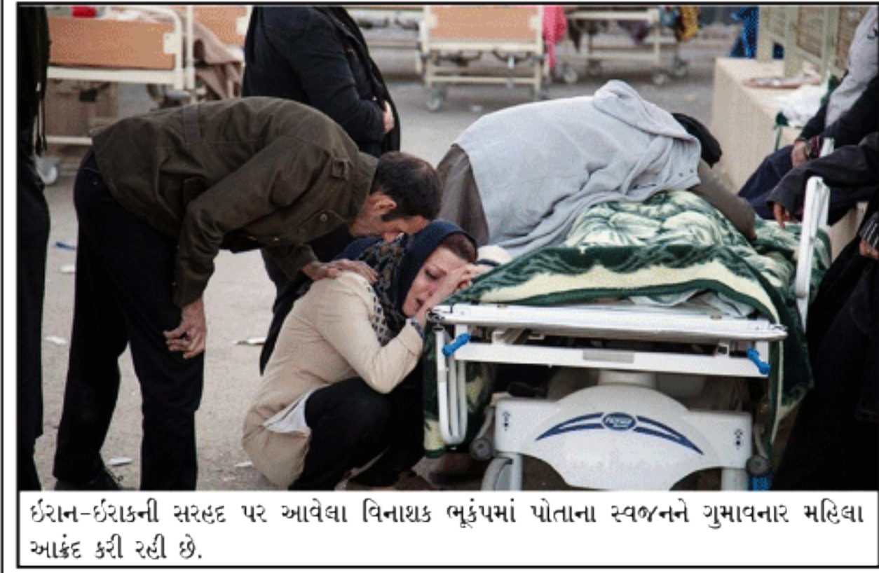
ઈરાન-ઈરાકની સરહદ પર આવેલા વિનાશક ભૂકંપમાં પોતાના સ્વજનને ગુમાવનાર મહિલા આફંદ કરી રહી છે.

નવી દિલ્હી, તા. ૧૩ ૫૦થી વધુ શહેરોમાં ઓછામાં ઓછા ૬૨ ટકાથી વધારે હાઉસિંગ પ્રોજેક્ટ અટવાઈ પડ્યા છે. ૬૨ ટકા અર્ધનિર્મિત આવાસ યોજના અટકી જવા માટે કેટલાક કારણો રહેલા છે. આવી જ રીતે ફ્લેટ્સ અને એપોર્ટમેન્ટ ટકાવારી થોડકા વધારે એટલે કે ૬૪ ટકા છે. આ આંકડા રિયલ એસ્ટેટ રિસર્ચ ફર્મ દ્વારા કરવામાં આવેલા અભ્યાસમાં સપાટી પર આવ્યા છે. ફ્લેટ ખરીદારોના હિતોના સંરક્ષણ માટે ક્રમ કરનાર સંસ્થા કોર્ટ દ્વારા રેરાને રિસર્ચ કંપની લાઈસેન્સ ફોરસ દ્વારા એકત્રિત કરવામાં આવેલા આંકડા હાથ લાગી ગયા છે. આના કહેવા મુજબ આશરે ૩૦ ટકા અંડર કન્સ્ટ્રક્શન એપોર્ટમેન્ટ તો બે વર્ષ અથવા તો વધારે સમય અટવાઈ પડ્યા છે. કોર્ટ દ્વારા રેરાના પ્રમુખ અભય ઉપાધ્યાયે કહ્યું છે કે બે અથવા તો વધારે વર્ષોથી અટવાઈ