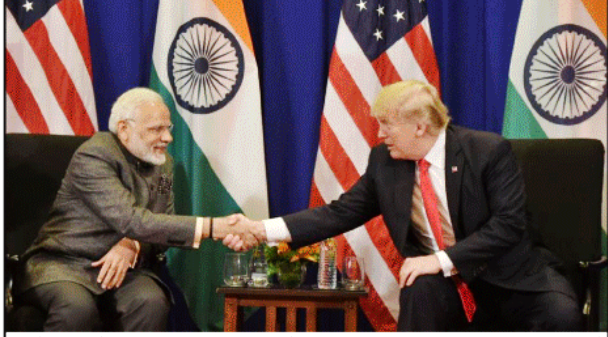
આસીયાન સમીટમાં ભાગ લઈ રહેલા અમેરિકી પ્રમુખ ડોનાલ્ડ ટ્રમ્પ અને વડાપ્રધાન નરેન્દ્ર મોદી વચ્ચે અનેક મુદ્દાઓ પર ચર્ચા થઈ હતી. ટ્રમ્પે વડાપ્રધાન મોદીની નીતિઓની પ્રશંસા કરી હતી.

ફિડબેકના આધાર પર કાયદાકીય બાબતો, નિયમો અને પ્રક્રિયાને વધારે સરળ બનાવી શકાશે. આ તમામ બાબતોને જીએસટી કાઉન્સિલની આગામી બેઠકોમાં સર્વોચ્ચ પ્રાથમિકતા આપવામાં આવનાર છે. સિમેન્ટ અને પેન્ટ જેવી કેટલીક વસ્તુઓ પર રેટ હજુ પણ ૨૮ અનુસંધાન પાન ૨ ઉપર