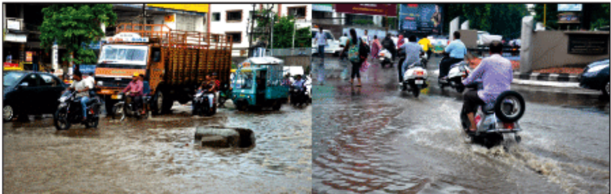
આણંદ શહેરમાં બપોરના સમયે વાતાવરણ પલટાઈ જઈ ધોધમાર વરસાદ વરસ્યો હતો. સતત પહેલા વરસાદથી ગણેશ ચોકડી, બોરસદ ચોકડી તથા અન્ય નીચાણવાળા વિસ્તારોમાં પાણી ભરાઈ જવા પામ્યા હતા. જ્યારે વિધાનગરમાં વરસાદી ઝાપટાંથી બોર્ડ નમી ગયું હતું.

આણંદ, તા.૧૨ આણંદ શહેરના શહેરી જનોને છેલ્લા ઘણા દિવસોથી અસહ્ય બાક અને ઉકળાટ અનુભવી રહ્યા હતા. સપ્ત પડી રહેલી ગરમીથી લોકો ત્રાસિમામ પોકારી ઉઠ્યા હતા. ત્યારે આજે બપોરે ૧ વાગ્યાના સુમારે આકાશમાં કાળા ડીમાંજ વાદળોથી ઘેરાઈ ગયું હતું. પવન તથા કડાકા ભડકાના અવાજ સાથે સતત ૧ કલાક ધોધમાર વરસાદ વરસ્યો હતો. જેથી શહેરની ઘણી જગ્યાઓએ ટ્રાફિકજામ થઈ જવા પામ્યો હતો. આણંદ શહેરમાં આજે બપોરે ૧ વાગ્યે અચાનક વાતાવરણ પલટાઈ જઈ ૧ કલાક સુધી ધોધમાર વરસાદ વરસ્યો હતો. જેથી વાતાવરણ દંડુ થઈ જવા પામ્યું હતું. શહેરીજનોને બાક અને ગરમીથી ઘોરી રાહત અનુભવી હતી. વધુ પહેલા વરસાદને કારણે શહેરના માર્ગો પર ઠેર ઠેર પાણી ભરાઈ જવા પામ્યા હતા. જ્યારે ઘણી જગ્યાએ ટ્રાફિક જામ થઈ જવા પામ્યો હતો. શહેરમાં આવેલ ગણેશ ચોકડી, બોરસદ ચોકડી, યોગી પેટ્રોલ પંપ સામે, પાણી ભરાઈ જવા પામ્યા હતા. પાણી ભરાઈ જવાથી નાના વાહન ચાલકોને વાહન