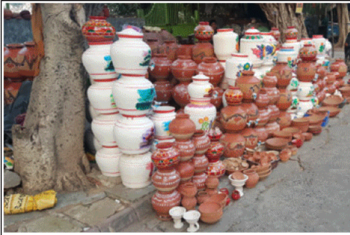
આણંદની જુની શાકમાર્કેટ પાસે રંગબેરંગી અને કલાત્મક ઘડા તથા પાણી ભરવા માટેના વિવિધ માટલાઓનું વેચાણ થઈ રહ્યું હતું. અવનવા આકર્ષક રંગોથી સુશોભિત માટલા સૌ કોઈને પ્રથમ નજરે પસંદ પડી જાય તેવા છે.