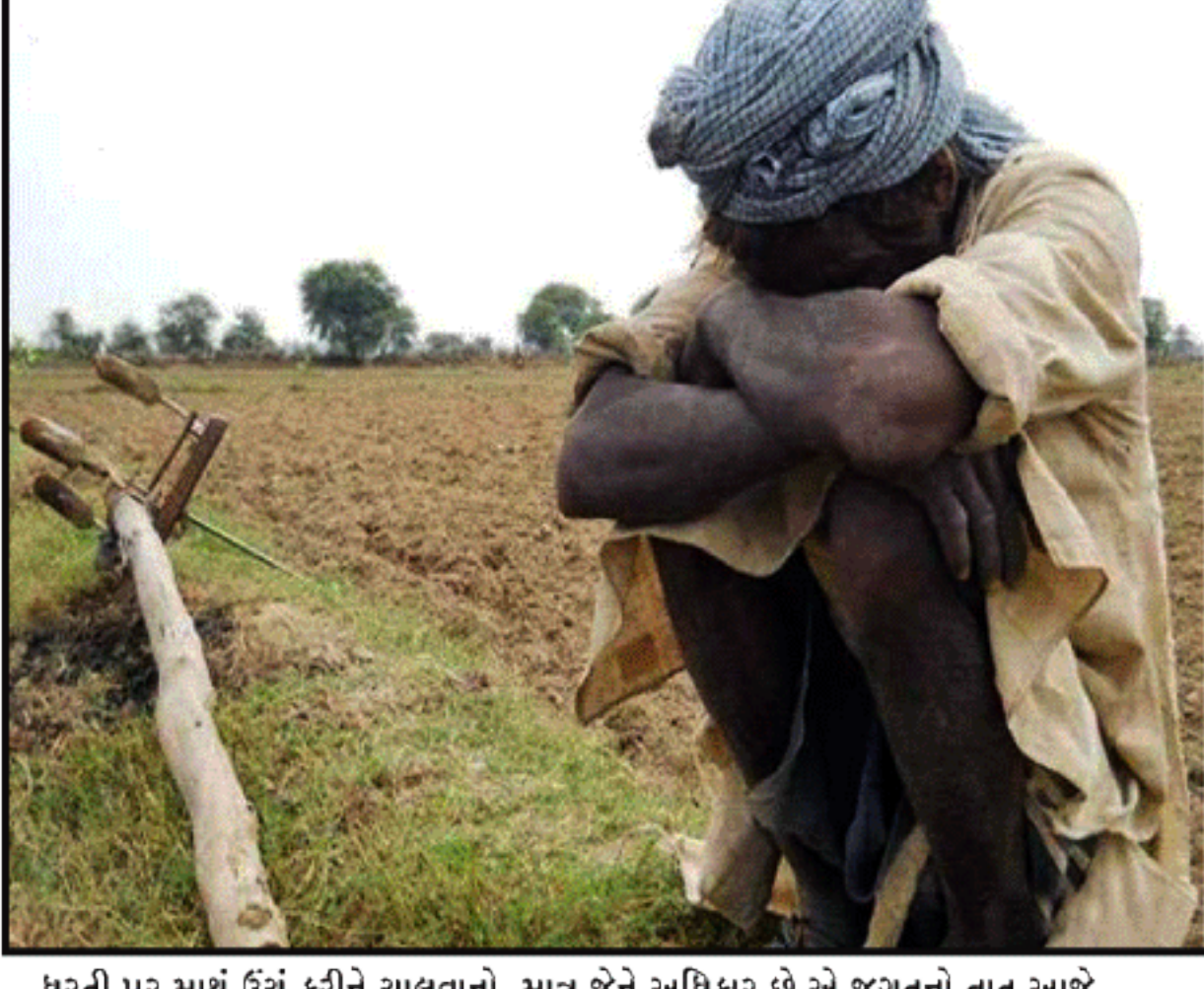
ધરતી પર માથું ઉંચું કરીને ચાલવાનો માત્ર જેને અધિકાર છે એ જગતનો તાત આજે દારુણ સ્થિતિમાં છે

કૃષિમિત્ કૃષસ્વ! ઋગ્વેદનો આ મંત્ર કહે છે કે, હે ખેડૂત તું ખેતી કર! ખેડૂતને માત્ર ખેતી કરવાનો આદેશ કરવામાં આવ્યો છે. પરંતુ ખેતી આજે ખેતી રહી નથી પણ ફજેતી થઈ ગઈ છે. એમાં સરકારે ૨૦૨૨ સુધીમાં ખેડૂતની આવક બમણી કરવાનું સ્વપ્ન બતાવ્યું છે. ગત મંગળવારથી રેવલપમેન્ટ બોર્ડ (એન.ડી.બી.), આણંદ ખાતે ચાલતા સેમિનારમાં એમ કહેવાયું છે કે ખેડૂત એના ખેતર પર સોલાર વીજ પેનલ લગાવશે તો એની આવક બમણી કરવામાં મદદરૂપ થશે. હવે જોઈએ કે વાસ્તવિક પરિસ્થિતિ શું છે. મહારાષ્ટ્રના યવત માલમાં કહેવાય છે કે ૮૦ ટકા ખેડૂતોએ એમની બહેન દીકરીઓના લગ્ન કરવા માટે જમીન ગીરવે મૂકી છે અથવા તેમને જમીન ગીરવે મૂકવી પડે છે. ૧૯૮૦માં બ્રિટિશ રાજમાં ખેડૂતોને સમસ્યા હતી. સરદાર પટેલે ખેડૂતોની સમસ્યાના સમાધાન માટે પ્રયાસ કર્યા અને તેઓ ખેડૂતોના સરદાર બન્યા. એમણે કહ્યું હતું, આ દેશમાં માથું ઉંચું કરી આ ધરતી પર